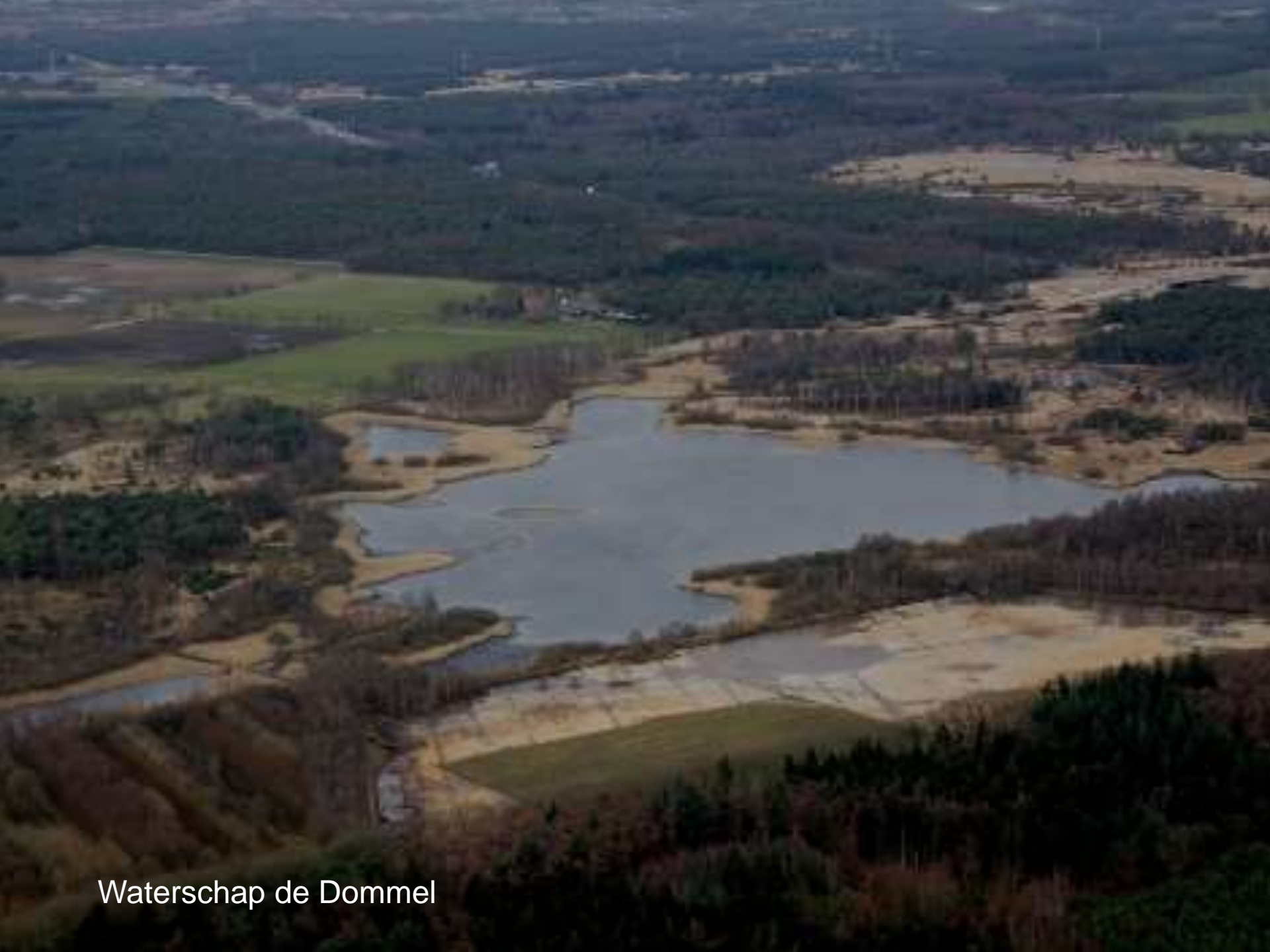
Waterschap de Dommel